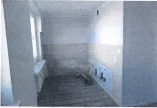
fol. Górnośląska 10A