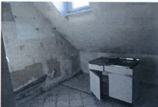
fot. Śródmiejska 23A