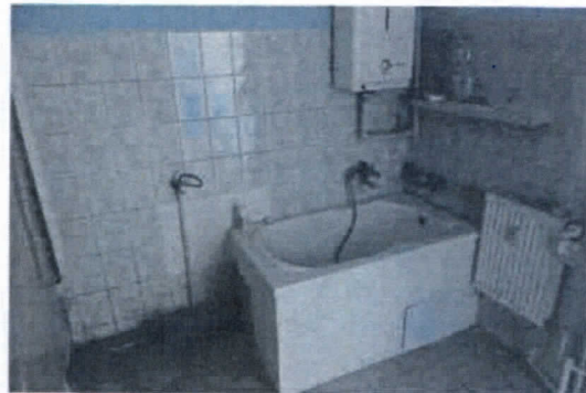
fol. Górnośląska 10A

Zgodnie z informacjami zawartymi w publikowanych ogłoszeniach o przetargach, obydwa lokale wymagały kapitalnego remontu, co potwierdzają załączone fotografie.