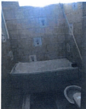
fot. Śródmiejska 23A