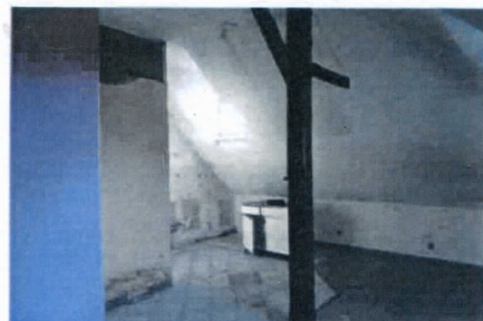
fot. Śródmiejska 23A